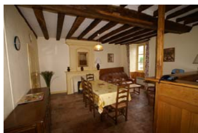
Gîte de Chenillé Changé

2 gîtes mitoyens. Ancien presbytère du XVIème dans le bourg avec accès à la Mayenne. Capacité de 6 à 8 personnes par gîte. Nous consulter pour les tarifs.