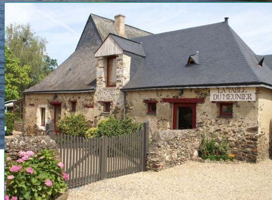
Restaurant La Table du Meunier