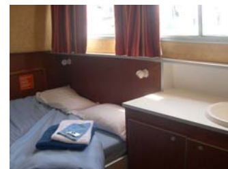
Coupe intérieure de la Pénichette 1500 R