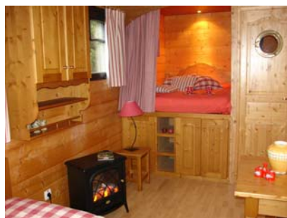
Intérieur d'une roulotte